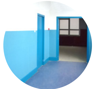
Distanciation sociale et déplacements dans les locaux ?