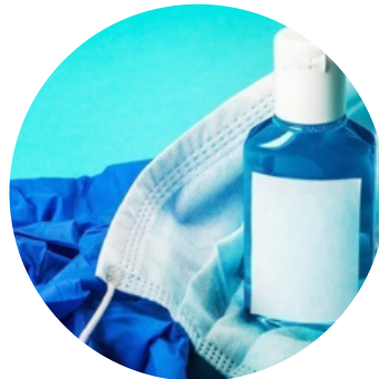
Présence de masques pour les élèves et les personnels en quantité ?