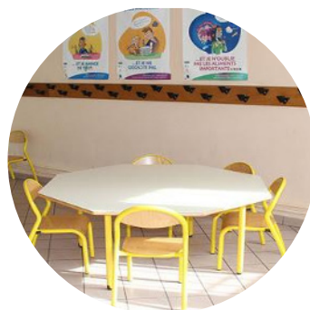
Protocole pour l'établissement et la cantine ?