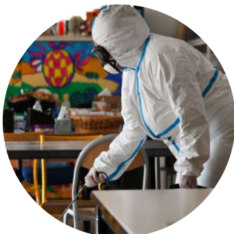
Désinfection et aération fréquente des locaux ?