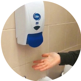
Présence de savon liquide et de serviettes jetables en permanence ?

Pour rappel, l'employeur a une obligation de résultats en matière de santé et sécurité au travail pour les personnels comme pour les élèves. L'administration engage donc sa responsabilité juridique en cas de manquement à son devoir de protection et il faut donc le lui rappeler afin qu'il prenne les mesures nécessaires (Article 2-1 du Décret 82-453 relatif à l'hygiène et à la sécurité du travail ainsi qu'à la prévention médicale dans la fonction publique].