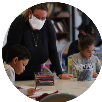
Limitation du brassage des élèves dans les locaux ?