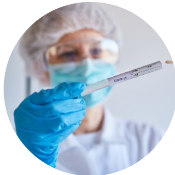
Communication des cas de Covid-19 aux personnels et aux familles ?